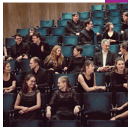
figure humaine kammerchor

Im Werk-Gespräch mit der Gastorganistin oder dem Gastorganisten